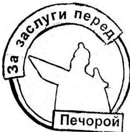
Рисунок знака отличия «За заслуги перед Печорой»

Слева по окружности на золотистом фоне располагается надпись красного цвета «За заслуги перед», внизу справа «Печорой»